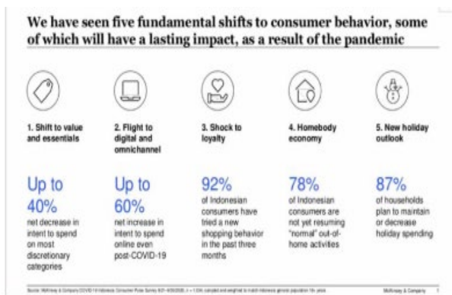
Gambar 3. Sentimen konsumen Indonesia saat pandemic Covid-19

Pandemi Covid-19 telah mengubah perilaku konsumen Indonesia secara umum, menurut survey yang dilakukan oleh (Potia and Praseco, 2020) pada awal pandemi di Indonesia, terdapat lima perubahan perilaku konsumen yang mendasar yaitu 1. Menurunnya pembelian diskresioner dan lebih mengutamakan pembelian kebutuhan yang esensial, 2. Meningkatnya pembelian secara online, 3. Terjadinya perubahan loyalitas, 4. Kegiatan lebih banyak dilakukan di dalam rumah, serta 5. Berkurangnya pengeluaran untuk berlibur.