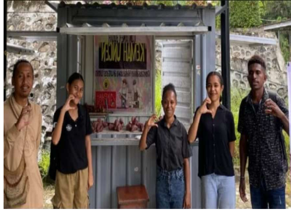
Gambar 4. Proses penjualan produk di container booth