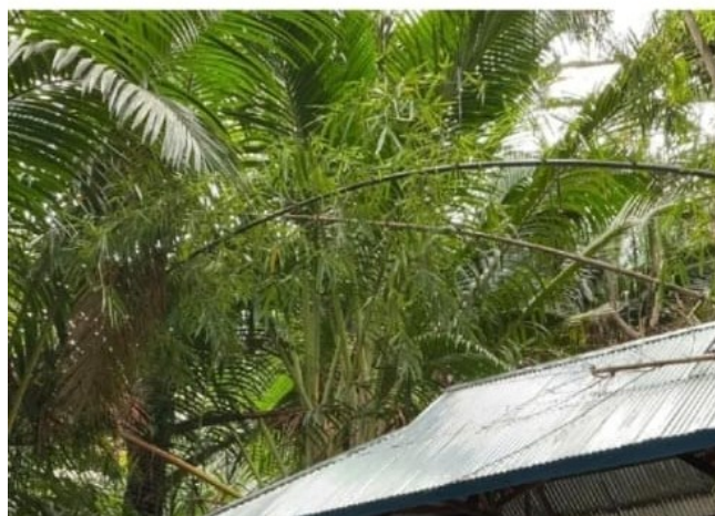
Gambar 1. Proses edukasi SAGUPRENEUR di hutan Sagu Kabupaten Jayapura