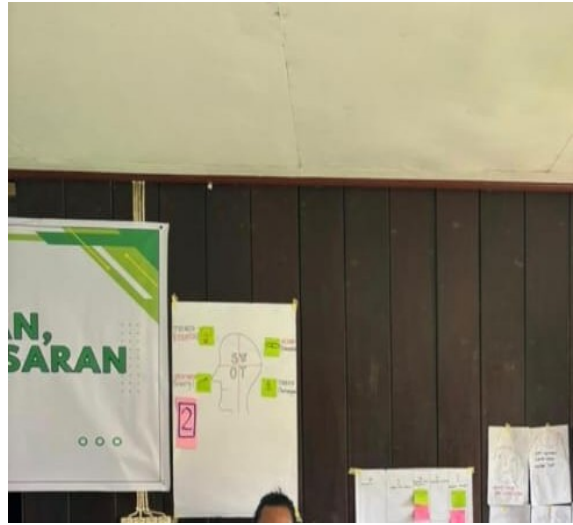
Gambar 3. Proses penyusunan Laporan Keuangan di Balai Kampung

Penguatan kapasitas manajerial pelaku usaha juga dilakukan melalui pelatihan dan pendampingan dalam penyusunan laporan keuangan sederhana berbasis aplikasi yang dirancang khusus untuk usaha kecil berbasis sagu.