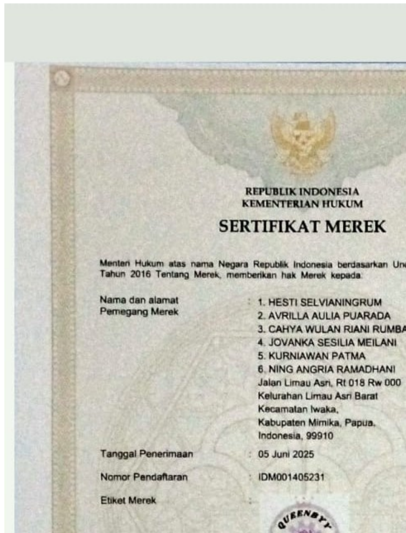
Gambar 2. Legalitas Usaha berupa Hak Merek Dagang Usaha

Dengan adanya legalitas usaha, pelaku usaha menunjukkan peningkatan kepercayaan diri dalam mengembangkan usahanya. Legalitas ini juga membuka peluang untuk menjalin kerja sama dengan pasar modern, memperluas jaringan distribusi, serta memberikan perlindungan hukum terhadap produk yang dihasilkan. Selain itu, pemahaman mengenai pentingnya kekayaan intelektual menjadi bagian dari peningkatan kapasitas kewirausahaan yang berkelanjutan.