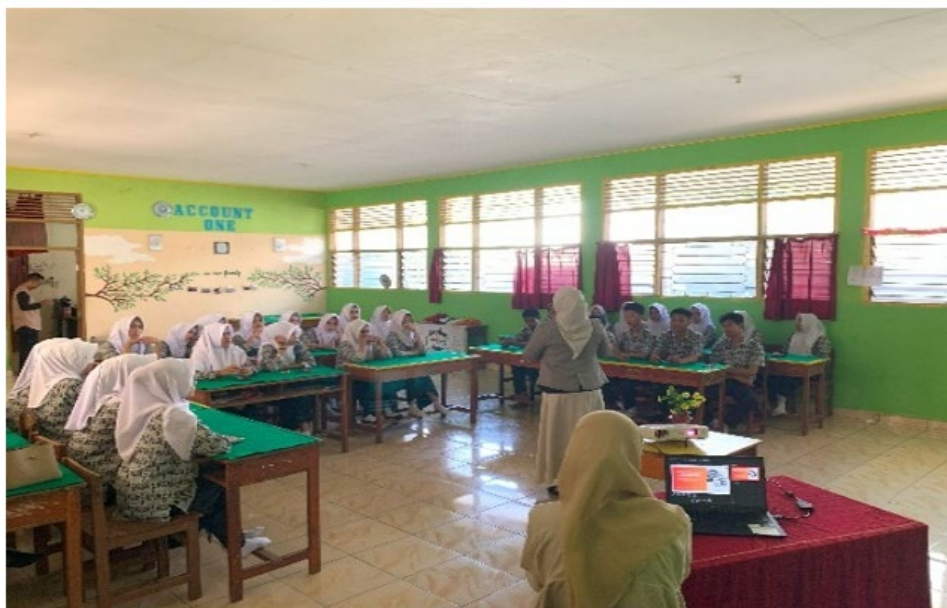
Gambar 1. Penyampaian Materi Edukasi Literasi Keuangan Digital

Kegiatan pengabdian dilaksanakan pada 16 Juli 2025 di ruang kelas SMKN 1 Bone dan diikuti oleh 32 siswa kelas XI Akuntansi. Sosialisasi dilakukan dengan membahas mengenai pengelolaan keuangan pribadi menggunakan aplikasi digital seperti Money Lover , Finacialku dan E-wallet (Dana, OVO, GoPay, dan lain-lain). Siswa juga diajak untuk melakukan simulasi pencatatan keuangan menggunakan lembar kerja manual sebagai alternatif bila belum mengakses aplikasi secara langsung. Kegiatan berlangsung interaktif, dengan siswa antusias bertanya dan berdiskusi mengenai pengalaman mereka dalam menggunakan e-wallet dan kendala yang mereka hadapi (Gambar 1).