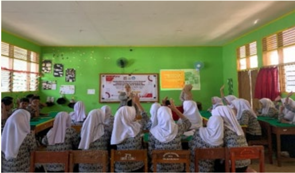
Gambar 2. Diskusi dan tanya jawab