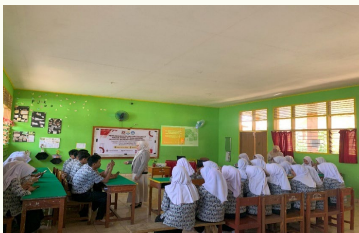
Gambar 4. Pengisian post-test

rata 94,84. Meskipun peningkatannya terlihat hanya sebesar 9,53 secara kuantitatif, hal ini tetap menunjukkan adanya perubahan positif dalam pemahaman siswa. Peningkatan ini mencerminkan keberhasilan awal dari kegiatan pengabdian, terutama dalam menumbuhkan kesadaran siswa akan pentingnya literasi keuangan digital dalam kehidupan sehari-hari dan dalam menghadapi tantangan ekonomi di era digital. Hasil ini juga menjadi dasar perlunya pelatihan lanjutan yang lebih mendalam dan berkelanjutan.