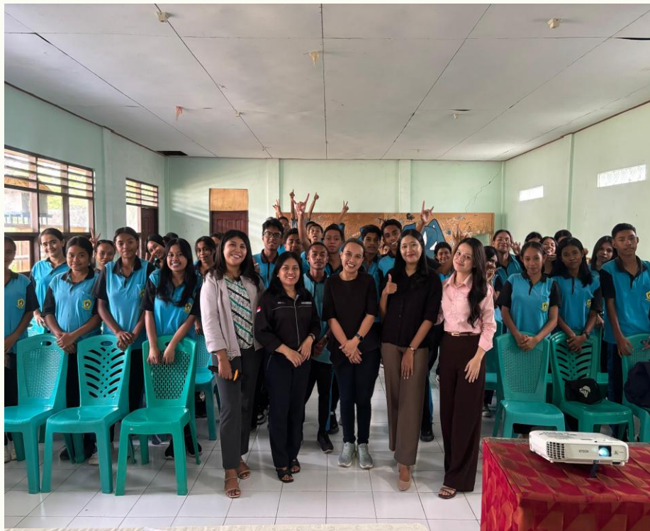
Gambar 2. Dokumentasi Setelah Kegiatan Sosialisasi

Kegiatan ini menunjukkan bahwa pendekatan edukatif dan partisipatif dalam membangun pemahaman siswa/siswi tentang anti fraud sangat efektif dalam meningkatkan kewaspadaan dalam praktik keuangan. Hasil peningkatan pemahaman siswa/siswi setelah sosialisasi mencerminkan keberhasilan metode komunikasi yang sederhana, interaktif, dan disesuaikan dengan konteks local. Remaja adalah pengguna aktif media sosial dan internet, yang rentan terhadap penipuan online seperti phishing, investasi palsu, pinjaman online ilegal, dan penipuan belanja online, sehingga melalui pendidikan anti-fraud, siswa akan lebih waspada dan tahu bagaimana mengenali dan menghindari penipuan digital.