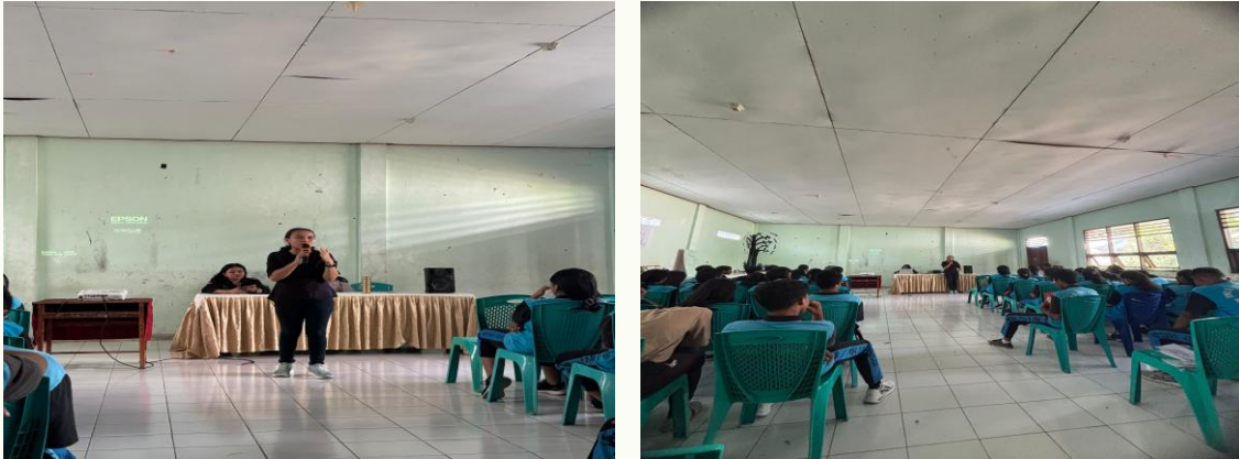
Gambar 2. Kegiatan Sosialisasi Anti Fraud

mengetahui resiko yang terjadi Ketika melakukan fraud. Siswa/siswi berani mengutarakan pendapat mereka tentang kasus-kasus korupsi yang terjadi di Indonesia.