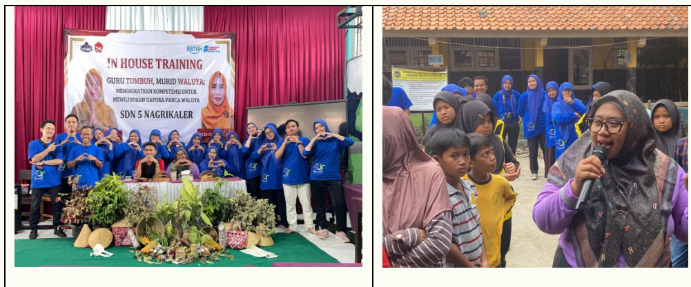
Gambar 2. Pendampingan In House Training TdBA

Proses transformasi dari pengetahuan individu menjadi budaya kolektif dimulai dari Initial Knowledge berupa pemahaman dan keterampilan dasar, yang kemudian diperkuat melalui Training untuk meningkatkan kemampuan dan kesiapan. Selanjutnya, Modelling berperan dalam mencontohkan perilaku dan teknik yang diharapkan, dilanjutkan dengan Conditioning yang memperkuat respons yang diinginkan melalui pengulangan dan penguatan. Tahap Habituation memastikan adaptasi dan respons yang efektif menjadi otomatis, sehingga pada akhirnya praktik-praktik yang telah terinternalisasi ini membentuk Developed Culture sebagai perwujudan perilaku dan keyakinan bersama yang tertanam kuat dalam kelompok atau organisasi.