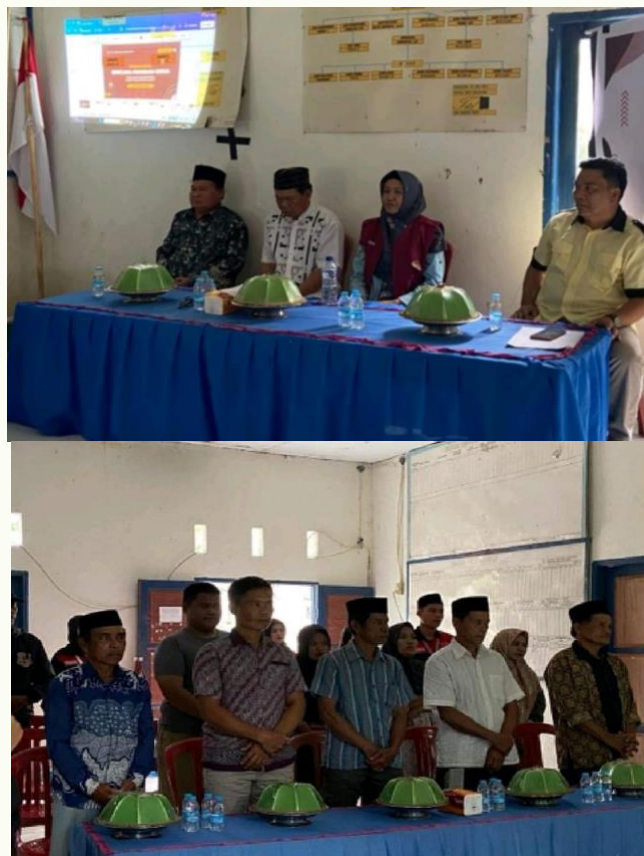
Gambar 2. Kegiatan Seminar Bisnis Digital

Dalam melaksanakan program pengabdian kepada masyarakat ini, menggunakan metode pendekatan partisipatif dengan melibatkan penduduk terkhusus kepada petani dan pekebun di dalam tiap tahap kegiatan diantaranya identifikasi permasalahan serta kebutuhan petani dan pekebun dengan melakukan survei lapangan untuk mengidentifikasi pemasaran hasil pertanian dan perkebunan, melakukan wawancara dan diskusi dengan petani dan pekebun yang berada di desa Ralleanak terkait hal-hal yang menjadi tantangan yang dihadapi dalam memasarkan hasil pertanian dan perkebunan. Selanjutnya diberikan edukasi, informasi dan pelatihan tentang bagaimana membangun jejaring bisnis berbasis sistem digital yang dapat meningkatkan pendapatan dan kesejahteraan penduduk. Diera society 5.0 (masyarakat 5.0), yaitu sebuah konsep masyarakat berpusat pada manusia yang mengintegrasikan teknologi canggih seperti internet of things (IOT) dalam meningkatkan kesejahteraan yang berkelanjutan. Terkait hal tersebut perlu dilakukan pendampingan langsung saat memberikan pelatihan dan informasi terkait bagaimana membangun jejaring bisnis dengan menggunakan sistem berbasis digital diantaranya memperkenalkan penggunaan media sosial dan bagaimana penggunaan e-commerce, setelah pendampingan dilakukan evaluasi akhir untuk melihat dan menilai dampak dari kegiatan terhadap jejaring bisnis yang berbasis sistem digital terhadap pemasaran dan peningkatan pendapatan dan kesejahteraan penduduk terkhusus kepada petani dan pekebun.