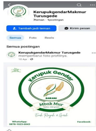
Gambar 3. Akun Facebook

Sebagai sarana perluasan jangkauan promosi, tim mengaktifkan akun Facebook bisnis khusus untuk produk ini. Media sosial dimanfaatkan sebagai alat pemasaran interaktif yang hemat biaya namun efektif dalam menjaga kelangsungan dan eksistensi bisnis kecil (Hendriadi dkk., 2019; Permana & Cendana, 2019).