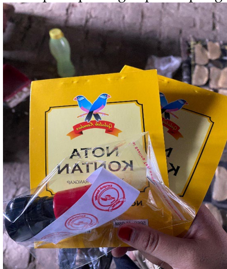
Gambar 6. Nota dan Stempel

Guna menertibkan administrasi penjualan, tim mengadakan stempel resmi dan nota belanja terstruktur untuk UMKM Kerupuk Gendar MakMur. Fasilitas ini sangat berguna dalam menciptakan tata kelola niaga yang lebih rapi, transparan, dan memberikan citra manajemen yang profesional kepada para agen penampung.