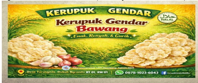
Gambar 2. Banner Usaha

perbaikan logo, tim memfasilitasi Selain pembuatan banner fisik sebagai penanda lokasi usaha resmi. Banner ini dipasang di depan rumah produksi untuk memberikan informasi visual yang jelas bagi masyarakat sekitar maupun kurir yang mencari lokasi UMKM Kerupuk Gendar MakMur (Damayanti dkk., 2024).