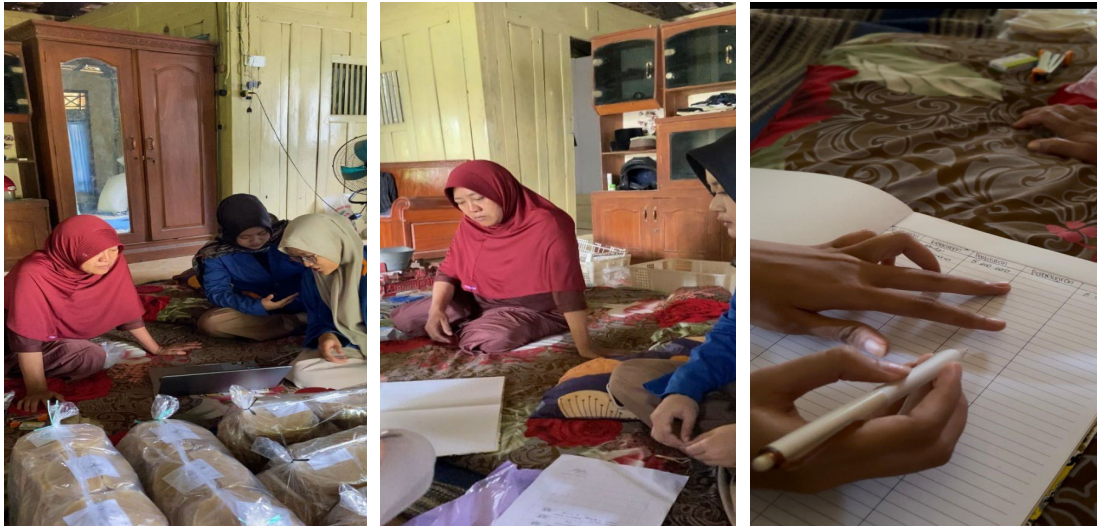
Gambar 7. Pendampingan Pencatatan Keuangan