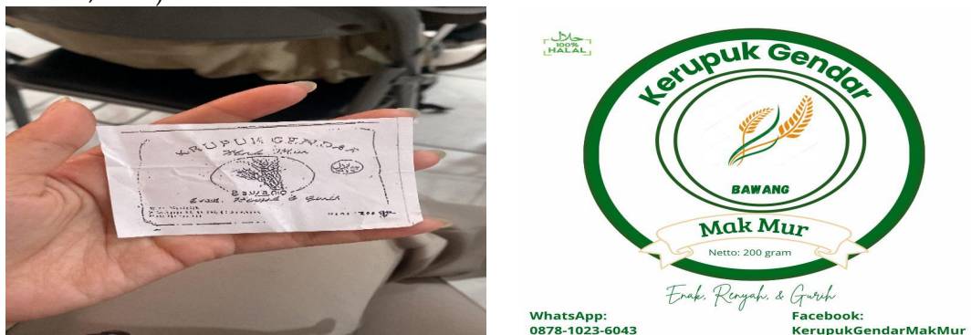
Gambar 1. Logo usaha

Langkah awal penguatan identitas merek dilakukan melalui peremajaan (redesain) logo usaha Kerupuk Gendar MakMur. Mengingat logo lama yang menempel pada kemasan sudah usang, buram, dan sulit terlihat, tim melakukan perbaikan desain ( digitalisasi ulang ) agar tampilan merek menjadi lebih tajam dan modern tanpa menghilangkan karakteristik aslinya. Langkah ini krusial untuk membangun kesadaran merek ( brand awareness ) yang kuat di hadapan konsumen (Alfiansyah, 2024; Maharani Dara Dinanti dkk., 2025).