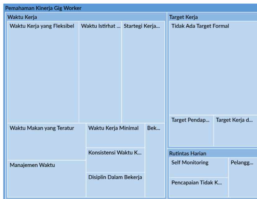
Gambar 1. Hierarchy Chart

Hierarchy Chart menunjukkan bahwa pemaknaan kinerja gig worker oleh pengemudi ojek online di Kota Ambon bersifat subjektif, kontekstual, dan berpusat pada pengelolaan diri (self-managed performance). Kinerja tidak dimaknai sebagai capaian target formal organisasi, melainkan sebagai kemampuan individu dalam mengatur waktu, menjaga konsistensi kerja, serta menyesuaikan diri dengan tuntutan harian pekerjaan.